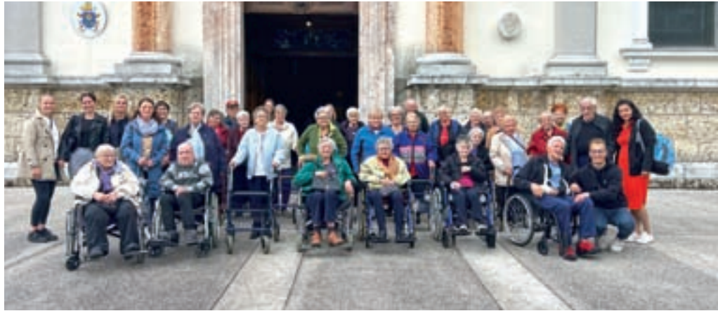
Stanovalci DSO Preddvor so obiskali Brezje.

Stanovalci se dnevno lahko vključujejo v različne dejavnosti: vaje za krepitev spomina, masažo stopal Biosinhron, Žoga bend, ustvarjalne delavnice, obisk knjižnice v delovni terapiji, barvanje mandal, pevski krožek, vrtnarske delavnice, npr. presajanje rož in skrb za visoke grede, gospodinske dejavnosti (peka piškotov, mafinov ...). Imamo tudi bralni krožek Modro brati in kramljati, ki ga vodi prostovoljka iz Mestne knjižnice Kranj. Mesečno v domu potekajo maše, vsak petek pa imamo s stanovalci molitveno uro. Obiskujejo nas tudi Člani društva Rdeči noski. Trgovina Sloga enkrat tedensko prihaja v naš dom in omogoča stanovalcem, da obiščejo trgovino. V okviru delovne terapije poteka terapija s pomočjo ži-