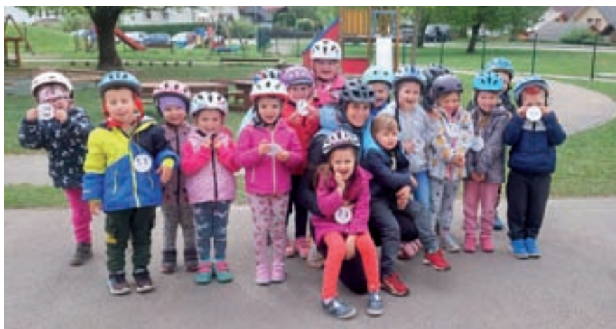
Kolesarski dan Žogic

V mesecu maju so nas v okviru projekta Igrajmo se, spoznajmo se, obiskali predstavniki Zavoda za razvijanje in izvajanje podpornih storitev za samostojno življenje (ZRIPS). Projekt smo izvajali že v preteklih letih in vedno je bil s strani otrok dobro sprejet. Igralni dan z otroki in mladostniki z motnjno v duševnem razvoju in avtističnim spektrom je bil tako za vrtčevske otroke kot za goste zelo lepa izkušnja. Skupaj smo se igrali različne igre, med seboj sodelovali, si pomagali in uživali v skupnih trenutkih. Delavnice so potekale tudi v vrtcu Črčček, za samo izvedbo na Beli pa je zaslužen gospod Miran Perko, saj je za delavnice velikodušno doniral sredstva. Vodstvo vrtca, zaposleni in vsi vrtničkarji se mu zahvaljujemo, da je otrokom omogočil, da so поблиže spoznali in doživeli, kaj pomeni biti »drugačen«. Veselimo se našega skupnega sodelovanja tudi v prihodnje. Urška Bizjak, vzgojiteljica, in Suzana Delavec, vodja vrtca