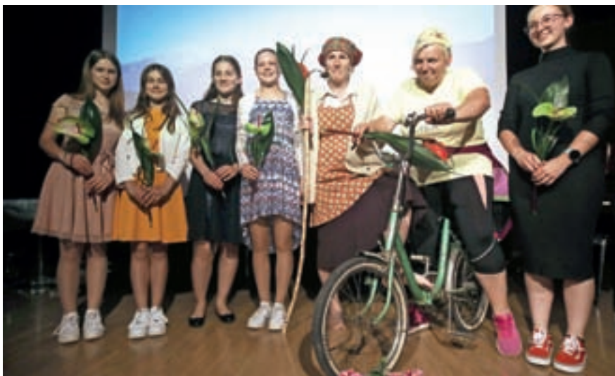
Ustvarjalci kulturnega programa tokratne slavnostne akademije ob občinskem prazniku

Cvek za dolgoletno aktivno delovanje na področju planinstva v občini ter Stane Nič za dolgoletno aktivno delovanje v Preddvoru. Slednji se je občinstvu predstavil tudi kot ljubiteljski fotograf, in sicer z razstavo na stenah stopnišča kulturnega doma,