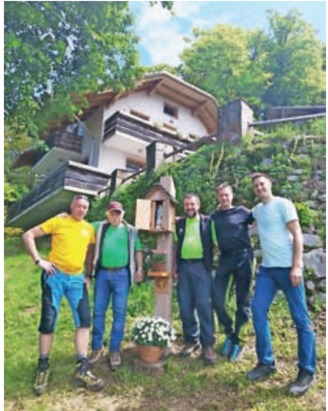
Del sodelujočih v projektu postavitve kapelice