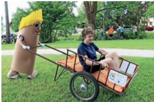
Vožnja s »kimpežem« je bila nekoč del vsakodnevnih otroških igr.

• Oglad spominske sobe Josipine Urbančič Turnograjske na gradu Turn Za ogled je potrebna predhodna najava na info@visitpreddvor.si ali 051 606 220.