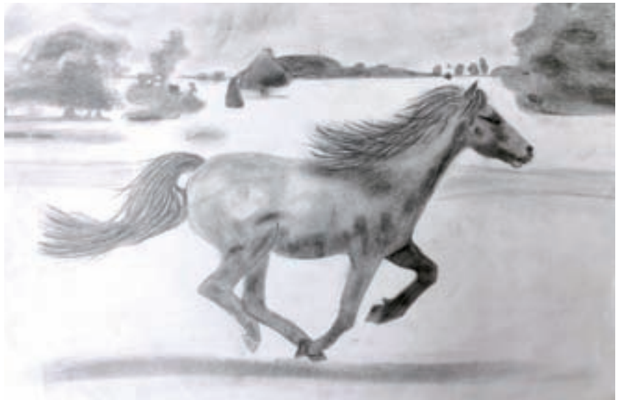
Emma Ribnikar, 8. a

Na začetku sem se za tutorstvo odločila zaradi MEPI-ja. Vedno mi je bilo všeč nekemu pomagati, zlasti če nekaj od