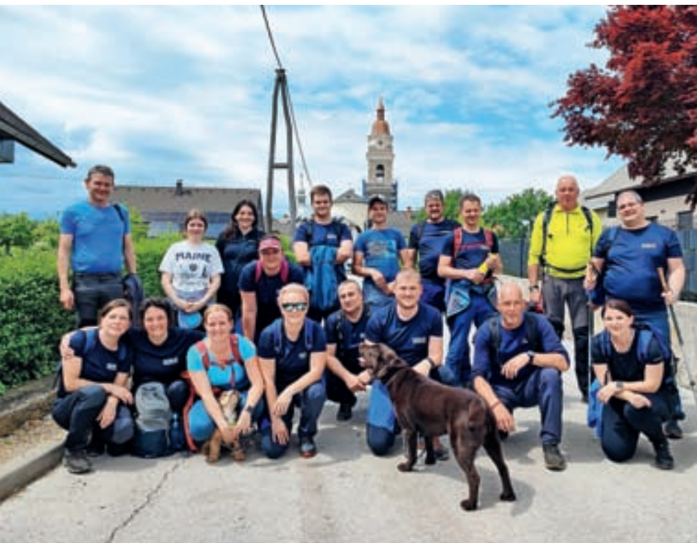
Na dan zavetnika gasilcev sv. Florijana smo se gasilci iz Preddvora udeležili vseslovenskega romanja in svete maše na Brezjah.

Čestitke vsem za pridobljena znanja in osvojena mesta. S takimi kadri se za usodo prostovoljnega gasilstva v Preddvoru ne bojimo. Najlepša hvala vsem mentorjem, tekmovalcem ter članom in članicam za sodelovanje in pomoč pri organizaciji in izvedbi orientacije v Preddvoru. Po končani orientaciji smo se člani društva zbrali ob hrani in pijači na dvorišču našega doma in se poveselili ob vseh uspehih, ki smo jih dosegli v zadnjem času.