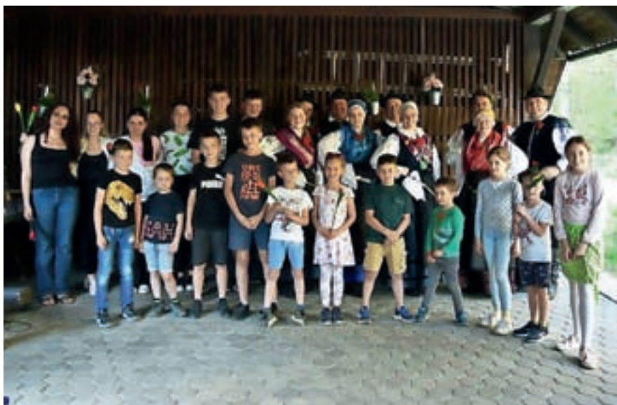
Nastopajoči, ki so popestrili prireditev Spomladanske rožce

Vrsto dogodkov v Bašlju izvajamo vsako leto, saj se vsakič znova po prijetnem druženju zavemo, kako pomembni so dobri medsebojni odnosi. Ob druženju in zabavi pa ne pozabimo tudi na gibanje. Tako bomo v juniju poskrbeli za že tradicionalni nogometni turnir, kjer se bodo pomerili stari in mladi, oženjeni in samski in še bi lahko naštevali. Pripravili bomo tudi turnir v košarki in namiznem tenisu. Naš največji dogodek Kmečki praznik pod Storžičem pa bo gostila avgustovska nedelja in bo letos že 37. po vrsti. Na njem ne bo manjkalo veliko dobre glasbe, dobrot iz kmečke kuhinje, bogatih dobitkov na srečelovu in starih kmečkih prikazov, zato že sedaj lepo vabljeni.