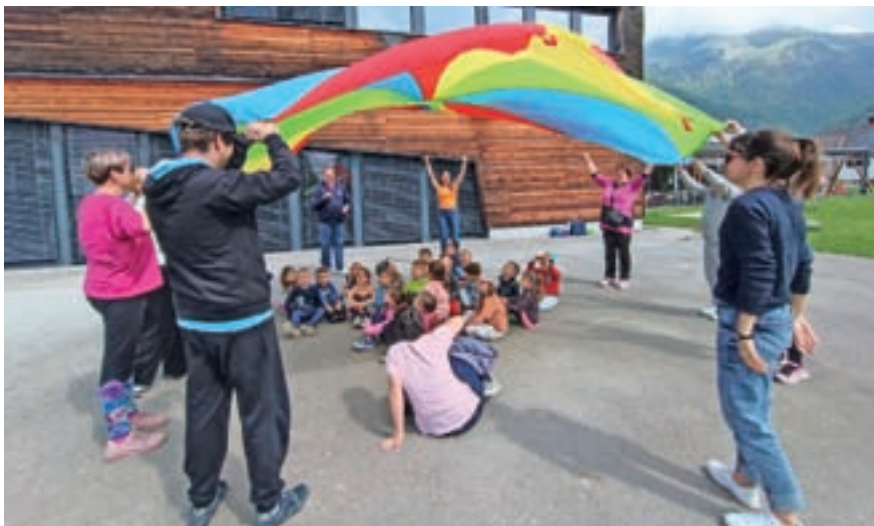
Igrajmo se, spoznajmo se. / Foto: arhiv vrtca

V Žogicah je meseca aprila prevladovala tema »Red je vedno pas pripet« – v okviru projekta Pasavček smo izvajali dejavnosti s poudarkom na prometni vzgoji ter varnosti v prometu. Izdelali smo svoje tabele za označeva-