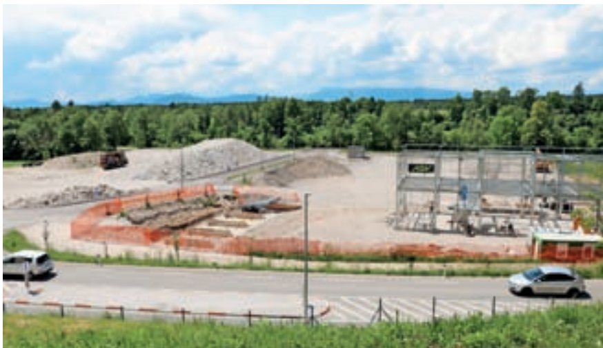
Prvi koraki v gradnji poslovnih stavb

V južnem delu ima zemljišče Ciril Zupin, ki upa, da se bo cona še širila. Občina po županovih besedah načrtuje dodatne površine za podjetnike severno od trenutnih parcel, kjer vidi tudi dobre možnosti za nekatere druge dejavnosti. V ta namen je zagнала postopek za sprejem občinskega podrobnega prostorskega načrta.