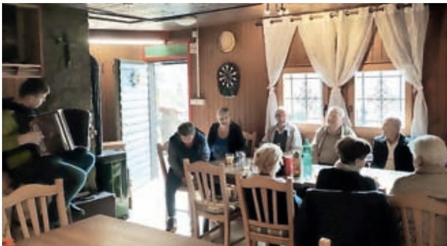
Veselo srečanje starejših v Bašlju